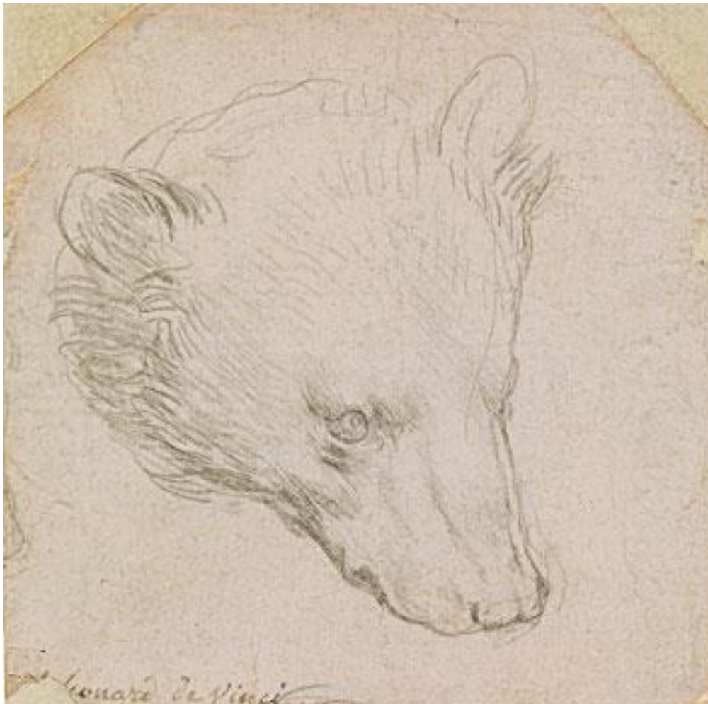
Леонардо да Винчи «Голова медведя». Около 1485 (серебряный карандаш на бледно-розовой бумаге)

стала своего рода Рубиконом, «точкой невозврата». За время существования коллекции накопилась масса научных исследований, связанных с ней. Мы захотели их опубликовать. Но решили сделать это не в печатном виде, а в электронном. Так возник сайт theleidencollection.com , положивший конец нашей анонимности. Он открыт — любой человек может зайти, скачать изображение картины, прочитать сопроводительные статьи.