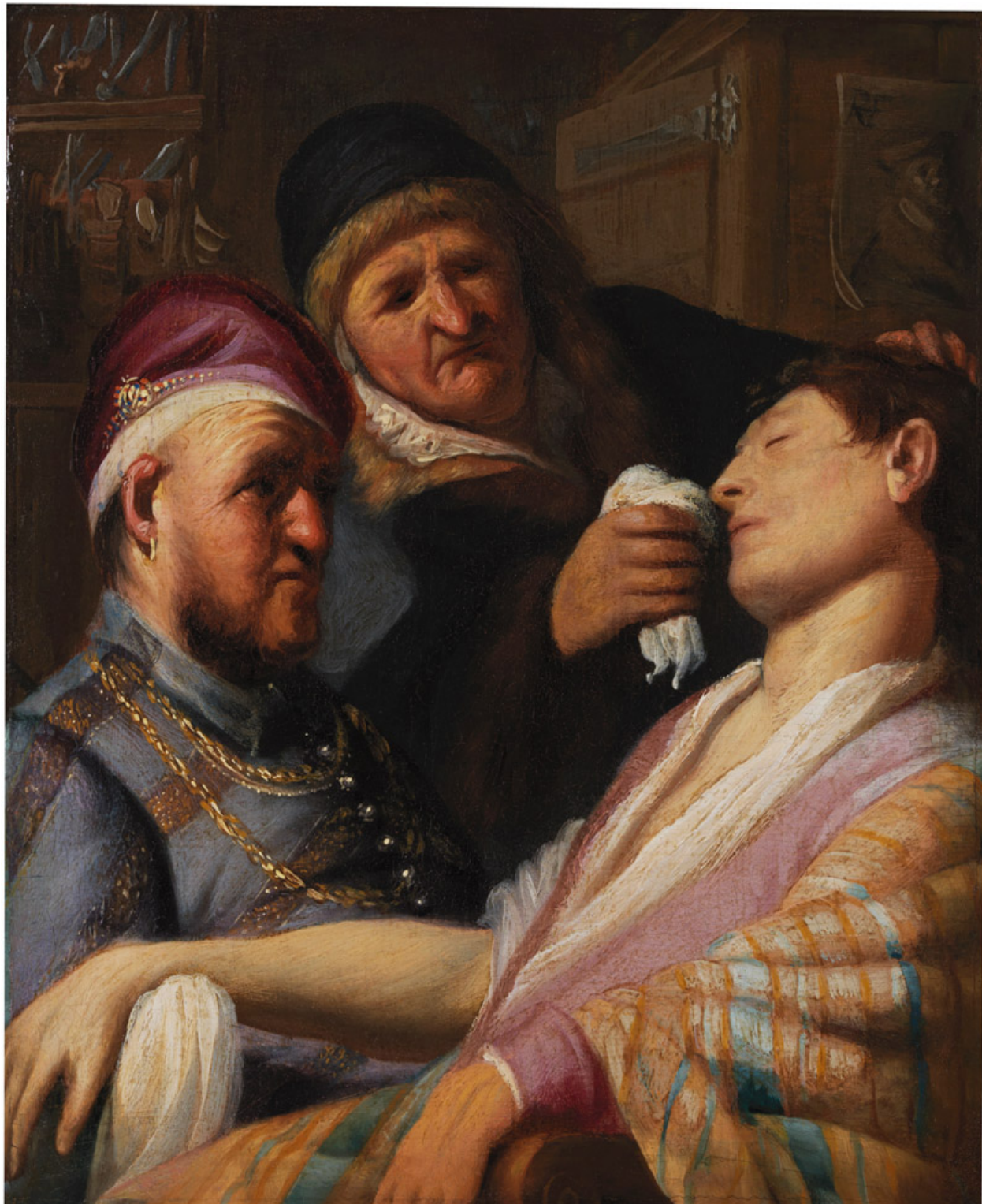
Рембрандт «Пациент без сознания / Аллегория обоняния» 1624-1625 гг.