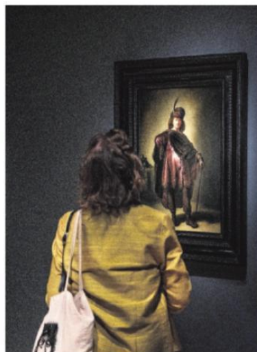
Links: Rembrandt, 'Borstportret van een oude man met baard'. Boven: Isaac de Jouderville, kopie van Rembrandts 'Zelfportret in oosterse kleding'.