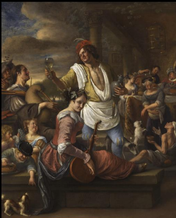
THE LEIDEN COLLECTION

er het piepkleine schilderij Buste van een bebaarde oude man (1633), slechts 10,6 x 7,2 cm groot. De overige werken zijn van schilders die een band hebben met Rembrandt, zoals Pieter Lastman, Ferdinand Bol (1616-'80) en Arent de Gelder. Servaa's Neijens