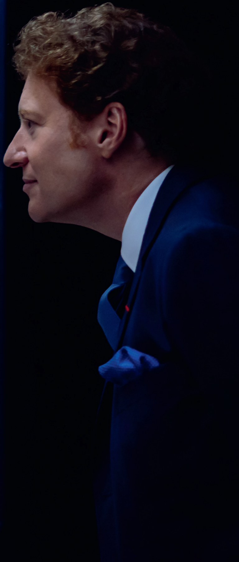
TEKST: THIJS DEMEULEMEESTER