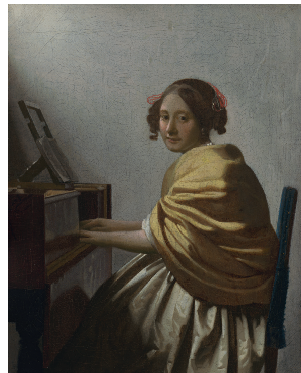
BOVEN ‘ZITTEDE VROUW AAN HET VIRGINAAL’ SCHILDERDE JOHANNES VERMEER TUSSEN 1670 EN 1672. ‘VANAF HET EERSTE MOMENT DAT IK HET WERK ZAG, VOELDE IK VERMEERS MAGIE.’