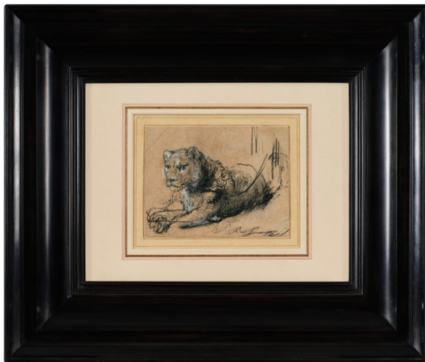
La obra enmarcada para la subasta.

¿Y qué tiene este papel para que alguien haya pagado más de un millón de euros por cada centímetro? Seguro que muchos lo consideran un precio obsceno, pero es que, más allá de la oportunidad de la subasta, estaba la exclusividad de la pieza. Era uno de los seis dibujos de leones que se conservan del pintor y el único en manos privadas (dos pertenecen al British Museum de Londres, el resto se reparte entre el Louvre de París, el Rijksmuseum de Ámsterdam y el Museo Boijmans de Rotterdam).