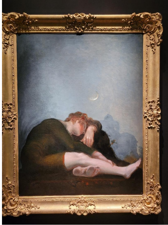
Solitude, Clair de lune par Johann Heinrich Füssli, vers 1794. Galerie Didier Aaron.