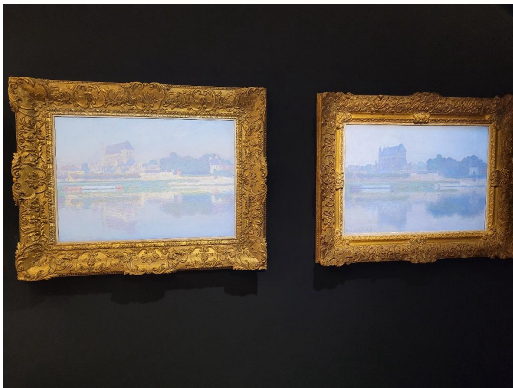
Deux tableaux de Monet représentant l'église de Vernon au pied de la Seine, chez Alon Zakaïm Fine Art.