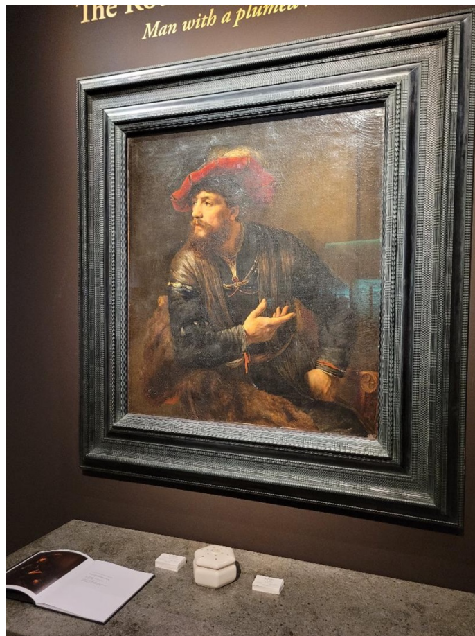
Willem Drost, Man with a Plumed Red Beret , 1654. Galerie Agnews.