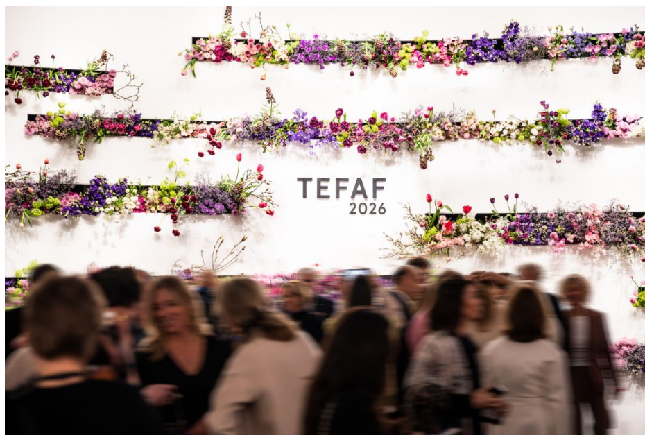
TEFAF Maastricht 2026.

Quello che abbiamo visto a Maastricht, tra caravelle di corallo e altri capolavori. E quello che musei e collezionisti hanno già acquistato tra gli stand, mentre sono in corso le ultime trattative