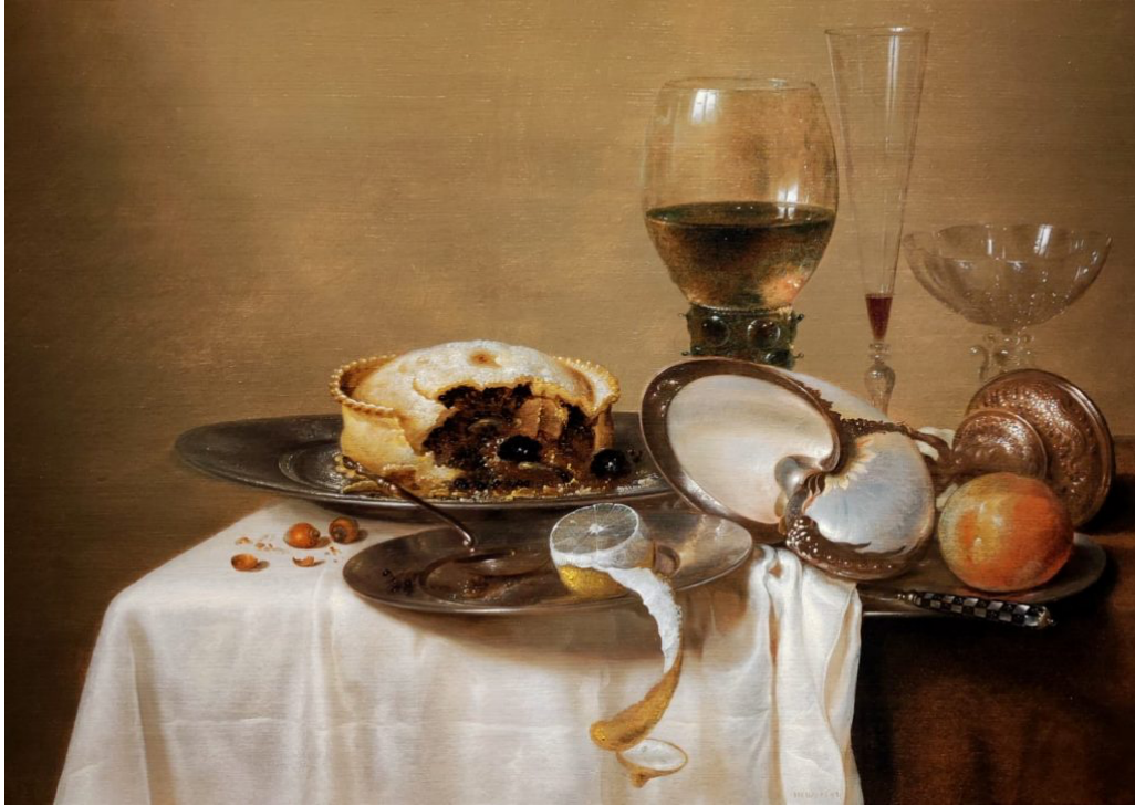
Willem Claesz Heda, A Banquet Still Life.