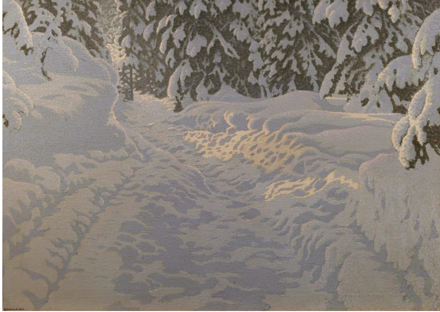
Gustaf FJÆSTAD, Paesaggio innevato, 1913.