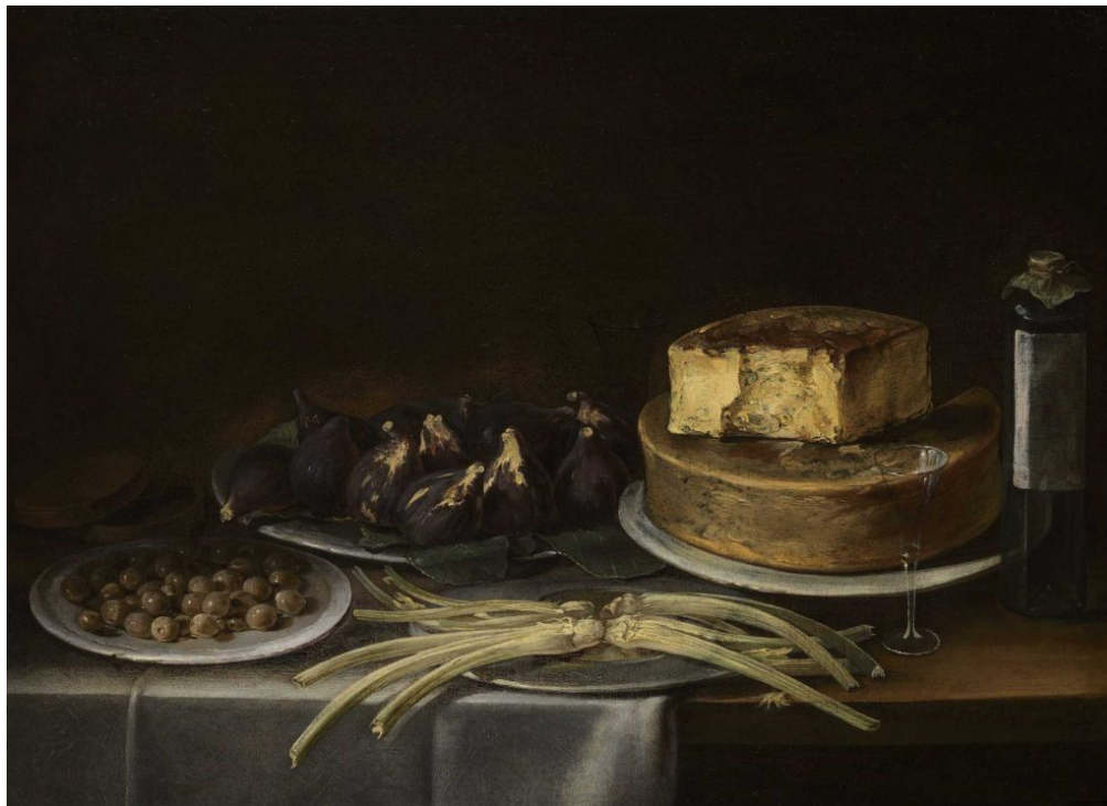
Giacomo Francesco Cipper, detto il Todeschini (Feldkirch 1664 – 1736 Milano), Natura morta con piatto di olive, piatto di fichi, formaggi, sedani, una bottiglia e calice, 1700.

€ 250.000. E risulta presto venduta nello stand di Matteo Salamon la natura morta di Giacomo Francesco Cipper, detto Il Todeschini («Un'edizione frizzante», la definisce il gallerista, «con un'offerta che sembra superare le edizioni passate e un pubblico che risponde positivamente»). E ancora. Bijl-Van Urk Masterpaintings, con prezzi tra €100.000 e €1 milione, piazza il ricciolo di limone di A Banquet Still Life di Willem Claesz. Heda a un collezionista privato («rappresenta il meglio di quello che una still life olandese abbia da offrire», riporta la didascalia, ora marchiata dal bollino scarlato) e Small Ships in Heavy Weather di Jan Porcellis alla Kremer Collection. Mentre il Nero's Vase della galleria Stuart Lochhead Sculpture, realizzato nel I secolo d.C. – faceva parte della residenza imperiale Domus Transitoria – è stato comprato per circa £ 1,8 milioni da un non meglio identificato museo degli Stati Uniti. Basta a rendere l'idea.