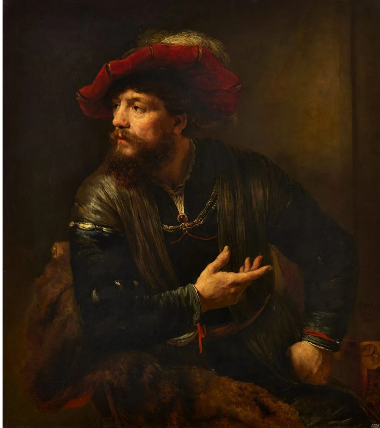
Willem Drost, Man with a Plumed Red Beret, 1654.

È un viaggio lungo settemila anni, compreso negli stand in pochi metri di moquette. Più che mai cross-category , dall'antico (impareggiabile) al contemporaneo (che vede il culmine a maggio, a New York), spaziando per il meglio di design, arazzi, gioielli, oggetti d'arte. I prezzi, altrettanto eterogenei, da decine di migliaia di euro nel settore "giovane" Showcase fino ai colossi internazionali. Alla spicciolata: la Stele di Medea da David Aaron, che ha trovato casa presso una «importante istituzione», aveva un prezzo richiesto di £ 450.000. Il Liechtenstein Tacuinum Sanitatis , manoscritto miniato padovano di metà Quattrocento, portato a Maastricht da Dr. Jörn Günther Rare Books, è stato venduto per CHF 5 milioni. L'americana Gallery 19C ha assegnato L'homme est en mer (1887-1889) dell'artista francese Virginie Demont-Breton al Van Gogh Museum per un prezzo stimato tra € 500.000 e 1 milione. Caretto & Occhinegro ha venduto il suo pezzo forte The Pentecost di Jean Cousin I a una collezione privata, così come The Capture of Christ di Pieter Coecke van Aelst, che aveva un asking price nella regione di