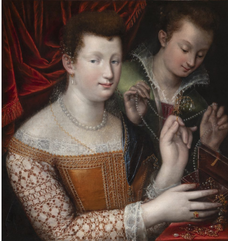
Lavinia Fontana, Portrait of Isabella Ruini Angelelli, 1593.

Si consumano con calma, senza la fretta spasmodica del contemporary , gli affari grossi per l'antico, anche negli ultimi giorni di fiera. Che, non a caso, dura più delle regine del contemporaneo. «In un momento storico segnato da tensioni geopolitiche, incertezze economiche e trasformazioni tecnologiche», dichiara a exhibart l'antiquaria Alessandra Di Castro, «l'arte assume sempre più il ruolo di bene rifugio. A TEFAF questo è evidente: la solidità delle opere, la provenienza, l'affidabilità degli operatori, l'originalità degli intrecci e degli accostamenti degli oggetti orientano le scelte dei collezionisti più attenti. I visitatori dimostrano sempre di più di essere aggiornati e informati, consapevoli di quanto accade nei diversi ambiti del nostro complesso ecosistema». Un mercato che aspetta, sedimenta, seleziona. Alla fine della fiera, il rito è compiuto.